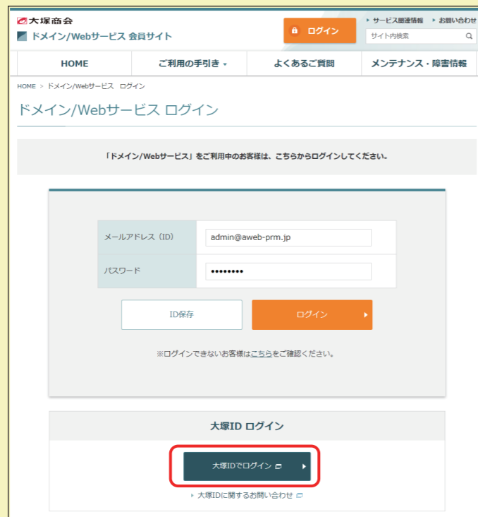
ドメイン/Webサービス会員サイト ログインページ

大塚IDでサービスにログインするには、会員サイトのログインページ ( https://dw.alpha-prm.jp/login.html ) の「大塚IDでログイン」からログインしてください。